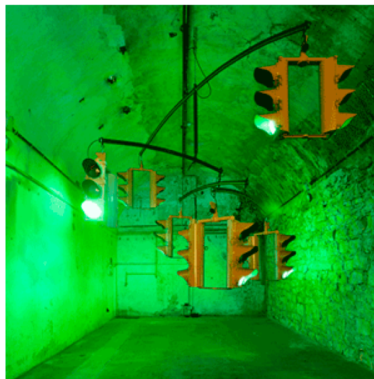
Ivan Navarro's Traffic

uita solo dalla fiera ufficiale, si muovono attorno ad essa una miriade di piccole fiere e piccoli eventi che approfittano dell'orda di visitatori amanti del genere. Nell'area di Messeplatz scoviamo anche Design Miami e Swiss art Awards. Quest'ultimo è un concorso dedicato a giovani artisti selezionati per accaparrarsi un premio di 25mila franchi. L'installazione che mi piace di più è fuori concorso, è in esposizione nel caffè ChezVelo all'ingresso dell'edificio: un trio folle di ragazzi (mecania.org) costruisce e anima macchine legendarie appartenenti ad un futuro distopico di ispirazione Tinguely: bici, catene, acqua, biglie metalliche ed il gioco è fatto. Il mio premio virtuale Swiss Art Awards va a loro. Purtroppo non ho i 25mila franchi da consegnare.