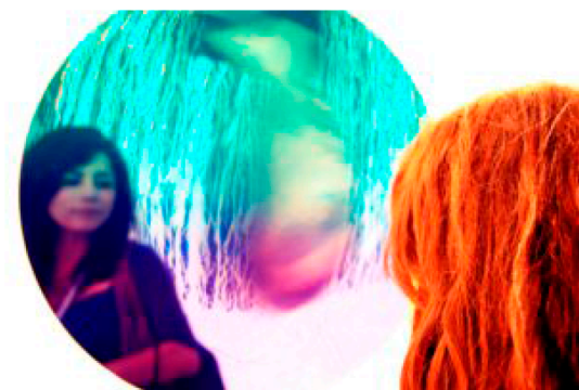
Mirror (Laser Red to Oriental Blue) 2016 Anish Kapoor

di artisti emergenti, tende oggi, dopo quasi cinquanta anni, ad ispirarsi neanche troppo liberamente a quell'arte lì. Affascinano le sculture aliene di Anish Kapoor che meritano almeno un selfie, storpiato dalla forma concava delle sue opere, inglobano figura e sonorità in un horror vacui impastato ad un certo misticismo.