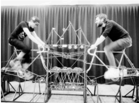
Ironsprint est exposé au Café ChezVelo du Swiss Art Awards à la Halle 4 de la Messe à Bâle.

Un ente fiera off è Liste, un evento secondario a cui hanno accesso una serie di gallerie che non possono partecipare (principalmente per questioni economiche) all'evento madre. Organizzato in un edificio industriale dismesso, una ex fabbrica di birra, si sviluppa su più piani e non propone nulla di entusiasmante, tant'è che l'architettura merita la mia attenzione molto più che l'arte esposta. Passo, dunque rapidamente tra gli stand espositivi catturata da poche cose e, finalmente, all'ultimo piano, quando avevo perso quasi le speranze, una galleria di Tokyo, Aoyama/Meguro, con la personale di Satoshi Ashimoto mi dà modo di riflettere sul ruolo intercambiabile dell'artista e dello spettatore quando