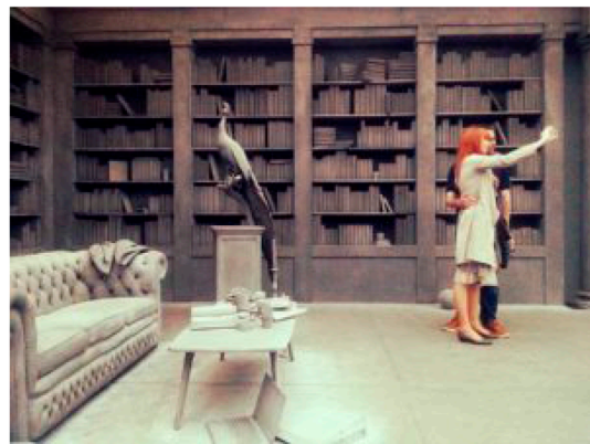
Hans Op de Beeck, The Collector's House , (2016). Courtesy of Marianne Boesky Gallery, Galleria Continua, and Galerie Krinzinger, Art Basel Unlimited, 2016.