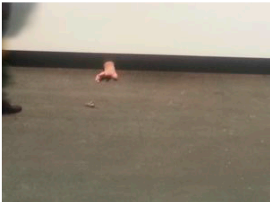
Laura Lima's Ascenseur at Art Basel Unlimited 2016.

di telecamere di sorveglianza, protagonisti delle immagini i fruitori del padiglione stesso. Ne scaturisce un sentimento a metà tra esibizionismo nel vedersi protagonisti di un'opera d'arte e la seccatura per la presa di coscienza del trattamento di violazione della privacy che subiamo quotidianamente in modo inconsapevole.