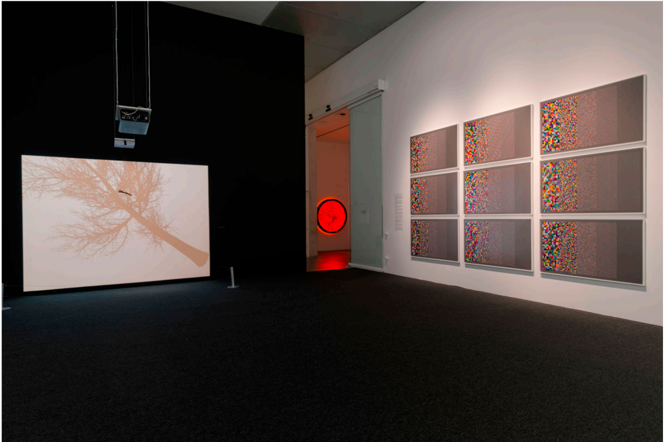
Exposición Pseudomatismos de Rafael Lozano-Hemmer.