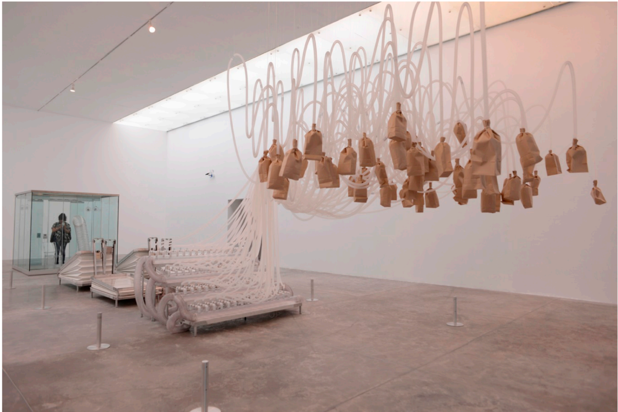
Pseudomatismos. Rafael Lozano-Hemmer. MUAC, 2015.

El artista parte del entendido que la tecnología no es un instrumento o herramienta, sino una forma inevitable de determinación de subjetividad y sociabilidad. A partir del juego con el tacto, la vista, la respiración, el oído y el movimiento del público, la exposición busca activar relaciones entre máquina, entorno y percepción, para con ello mostrar el modo en que la tecnología, el cuerpo y el cuerpo político son inseparables.