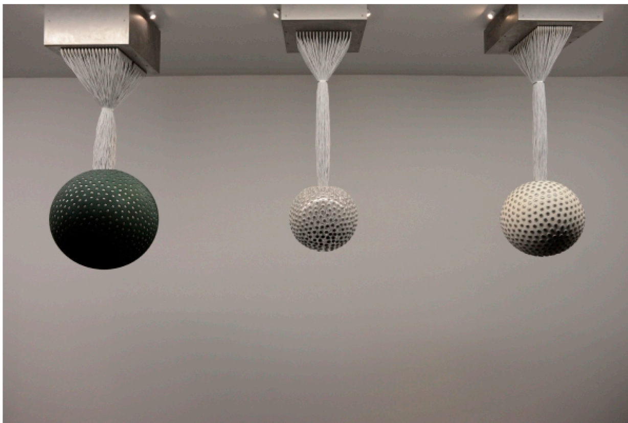
Pseudomatismos. Rafael Lozano-Hemmer. MUAC, 2015.