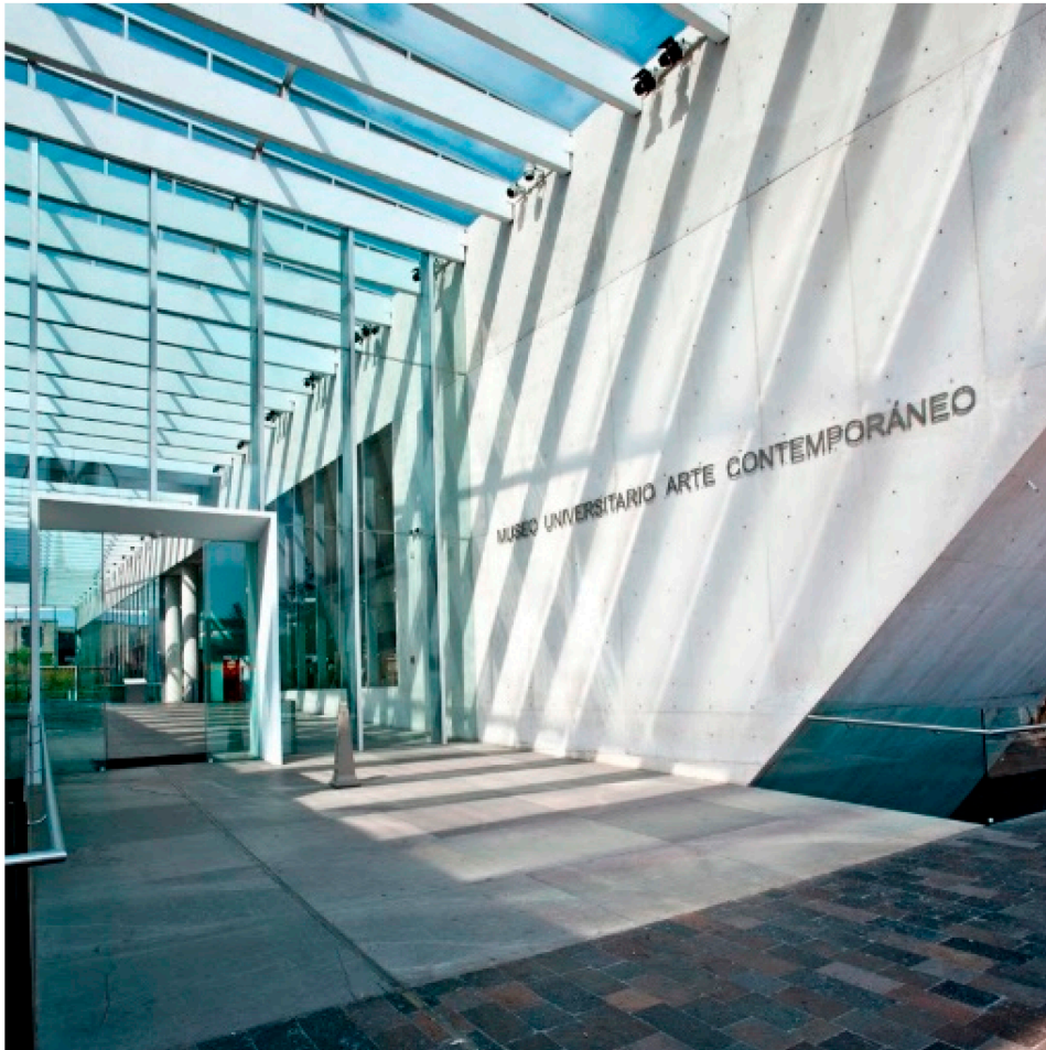
Centro Cultural Universitario. Insurgentes Sur 3000. Ciudad de México