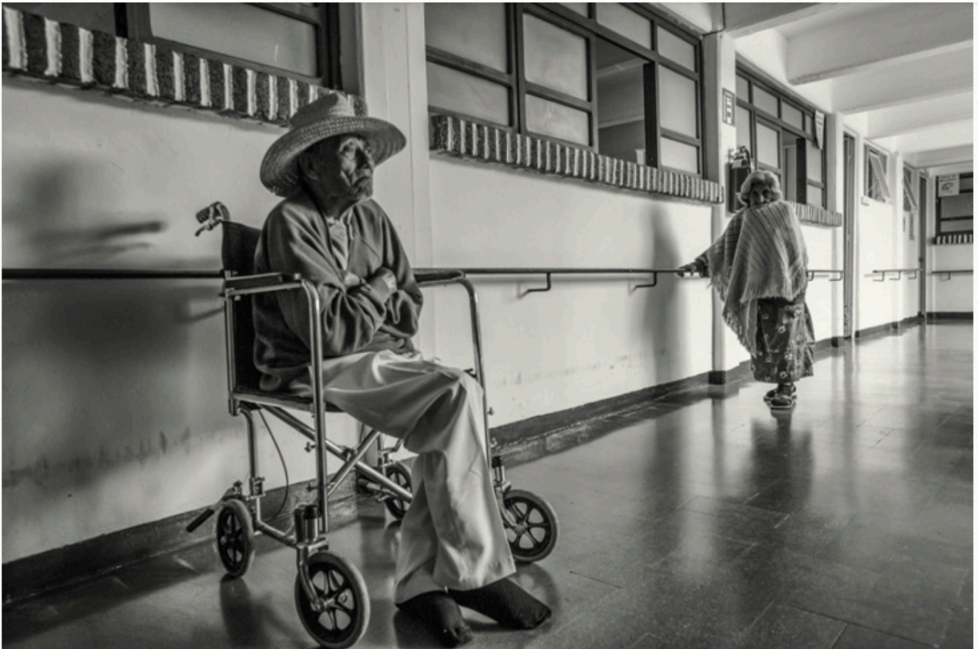
Del 20 de febrero al 15 de mayo 2016 Curadora Trisha Ziff.

La fotógrafa Alejandra López-Zaballa realiza este proyecto documental de carácter social que plasma la vida en un orfanato y un asilo de ancianos en Oaxaca. La artista comparte una visión sensible que fragmenta por completo las ideas estereotipadas de dichas circunstancias a partir del contraste y la relación de las fotografías utilizando la realidad como protagonista. El fundamento principal es dar a conocer una concepción solitaria: las emociones e interacciones del ser humano al inicio y el final de la vida en el mismo o diferentes entornos; “Principio & Fin” sugiere un profundo nivel de reflexión a partir del contexto expuesto.