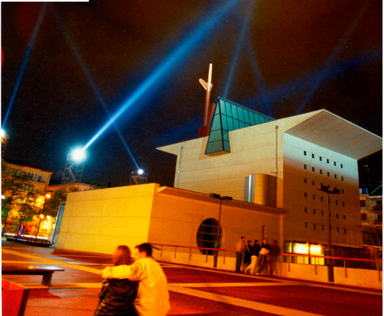
Alzado vectorial, Arquitectura relacional 4, 2002. Instalación pública interactiva/Interactive public installation