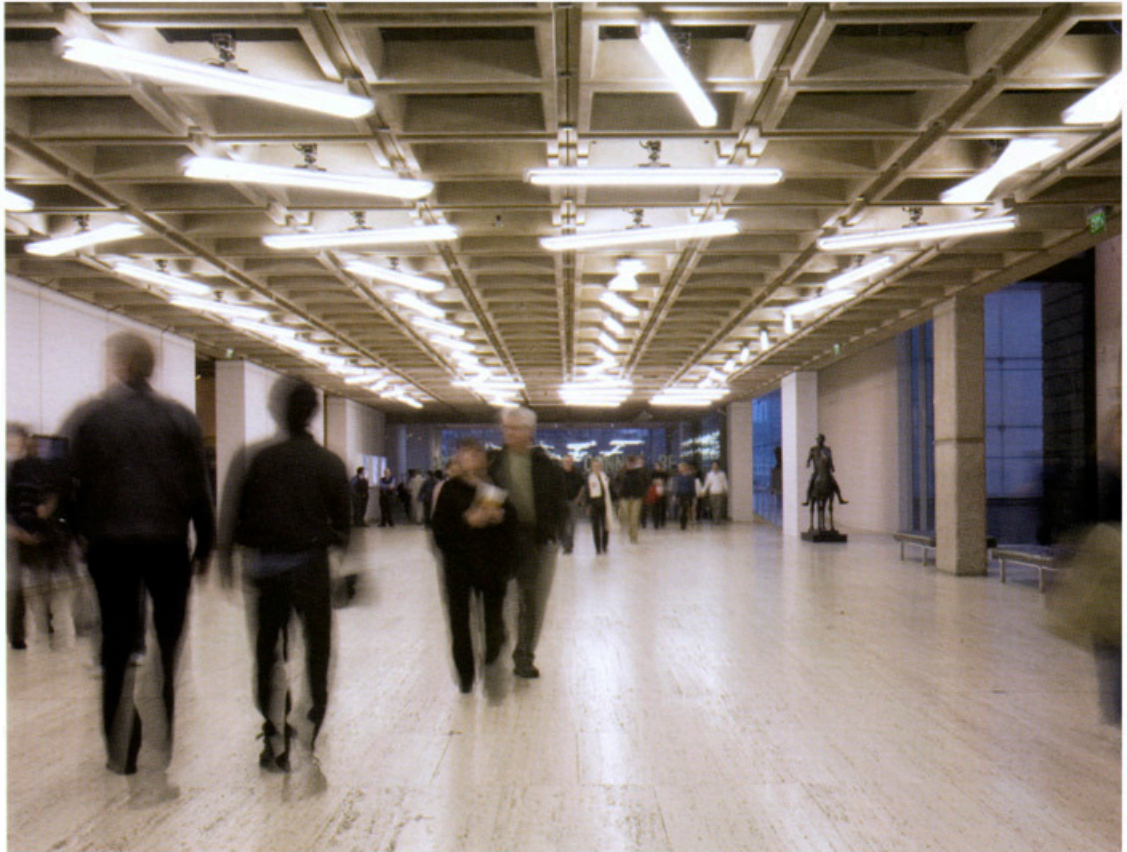
Homografías, subcultura 7, 2006. Instalación interactiva