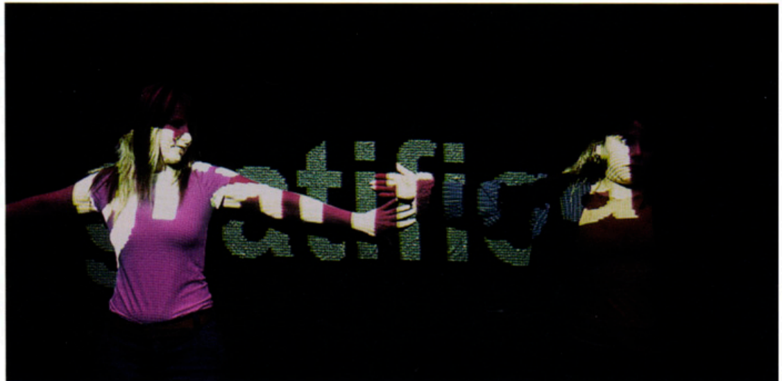
Público subtitulado, 2006. Instalación